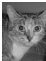
Nicky tigrée, blanche et rousse poil court