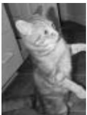
Rookie tigré roux poil court adulte