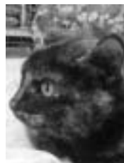
Fleurette écaille de tortue poil court adulte