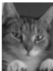
Marina tigrée et blanche poil court