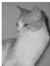
Macaroni blanc et roux poil court 9 mois