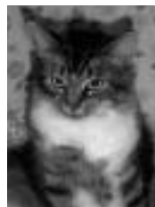
Marie-Ève tigrée et blanche poil mi-long