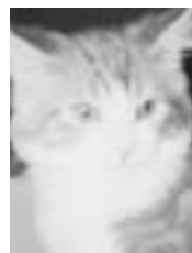
Justin roux et blanc poil mi-long 10 mois