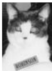
Robinson blanc et gris poil court