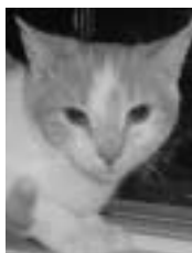
Cannelloni beige et blanc poil court 9 mois

Les tarifs d'adoption varient entre 55 $ et 70 $