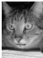
Oscar tigré poil court adulte