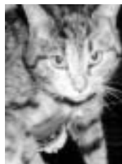
Nicolette tigrée, blanche et rousse poil court