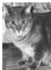
Toutsy tigré gris poil court