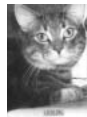
Liebling tigré gris poil court