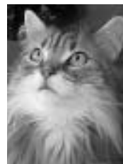
Sophia rousse et blanche poil mi-long