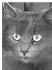
Tiloup tout gris poil mi-long adulte