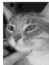
Ti-Gris tigré gris et blanc poil court 1 an