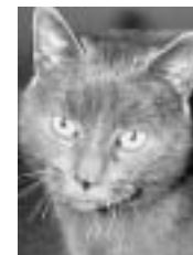
Christine toute grise poil court adulte