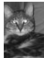
Édouard tigré gris poil court adulte