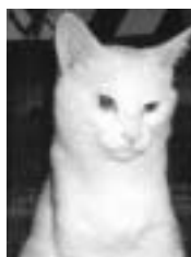
Beethoven tout blanc poil court dégriffé 4 p