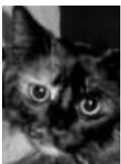
Camille écaille de tortue poil mi-long

Ils attendent depuis plus d'un an... Et pourtant, ils sont tous sociables chacun chacune avec sa personnalité. SVP, aidez-nous à faire adopter nos anciens et anciennes!