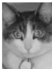
Souris tigrée et blanche poil court