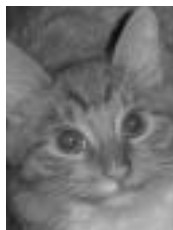
Ti-Gus roux et blanc poil mi-long 10 mois